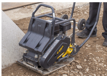
Robuste et fiable Courroies trapézoïdales complètement protégées contre les dommages