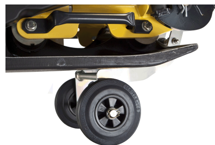
Transport sécurisé Poignées de transport (en série) et roues de transport (en option)