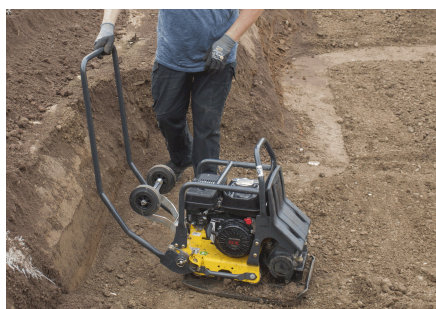
Léger et maniable Compact et à suspension