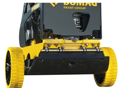
Einfacher und sicherer Transport Transporträder (optional)